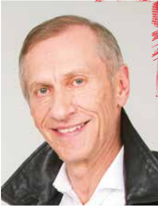
Graf-Putz | AK