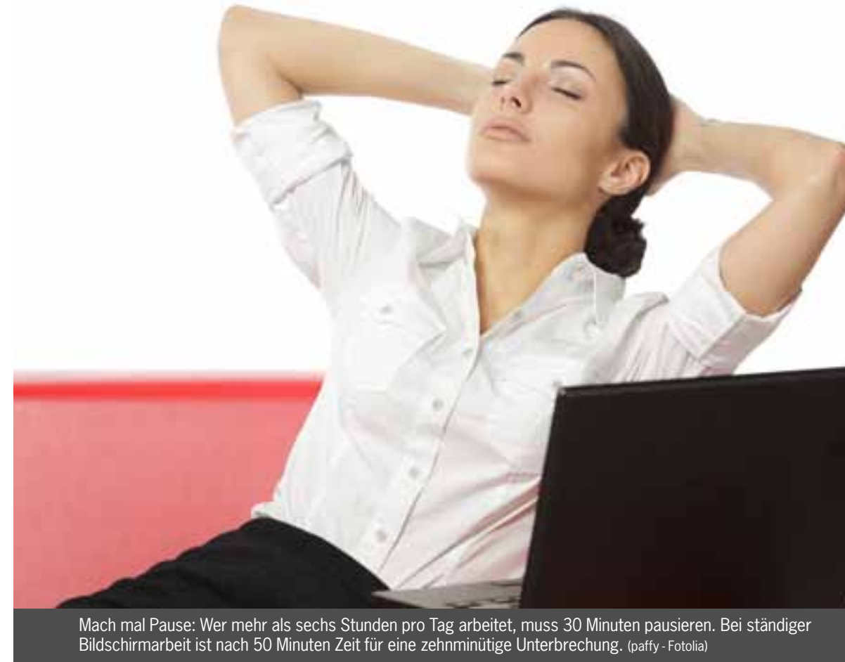
Mach mal Pause: Wer mehr als sechs Stunden pro Tag arbeitet, muss 30 Minuten pausieren. Bei ständiger Bildschirmarbeit ist nach 50 Minuten Zeit für eine zehnmütige Unterbrechung.

Tipps für Pausengestaltung: Wer schwitzt und schuftet, der sollte sich hinsetzen und ausruhen. Wer am Schreibtisch arbeitet, sollte ein paar Schritte gehen und eventuell auch ein paar Rückenübungen machen. Hilfreich ist übrigens auch ein Blick ins Grüne: Forscher fanden heraus, dass Menschen, die in ihrer Pause in den Park gehen, erholt sind als diejenigen, die durch eine Innenstadt laufen.