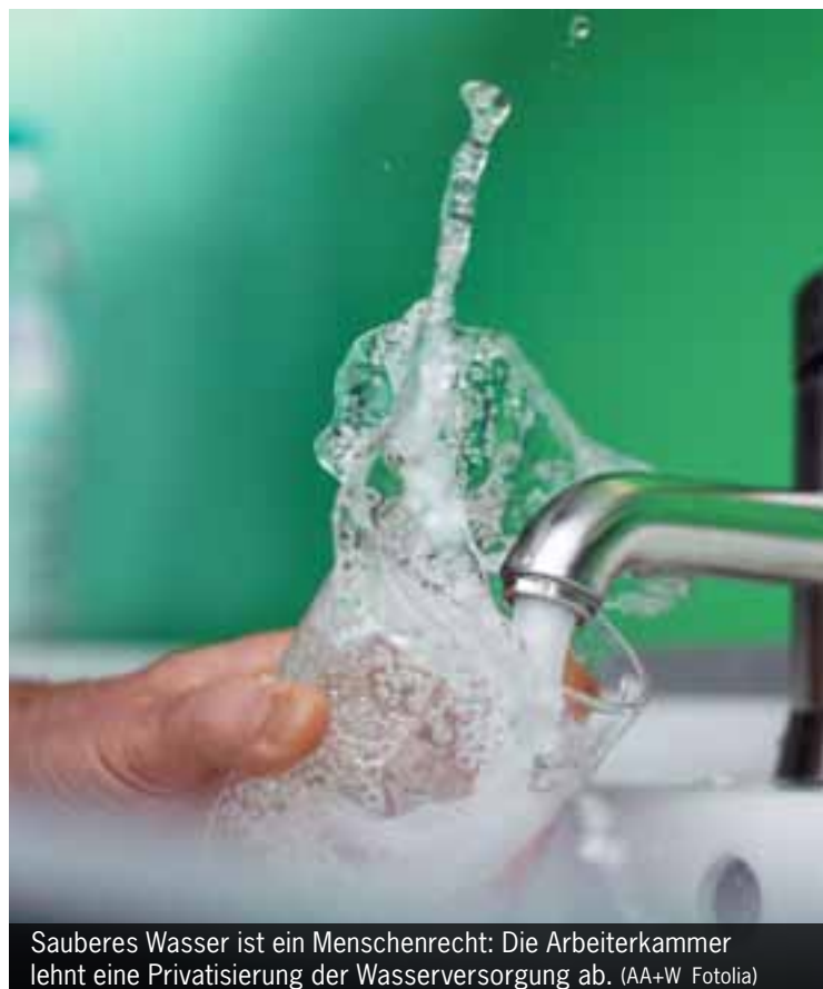
Sauberes Wasser ist ein Menschenrecht: Die Arbeiterkammer lehnt eine Privatisierung der Wasserversorgung ab.

Die AK unterstützt die EU-weite Bürgerinitiative „Wasser und sanitäre Grundversorgung sind ein Menschenrecht“. In einer Petition, die bereits eine Million EU-Bürger unterzeichnet haben, wird verlangt, die Versorgung mit Trinkwasser und die Bewirtschaftung der Wasserressourcen nicht den Binnenmarktregeln zu unterwerfen. Mehr unter www.right2water.eu/de .