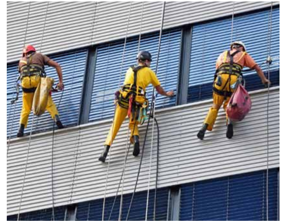
Eine bessere Absicherung für Leiharbeiter bringt das neue Arbeitskräfteüberlassungsgesetz.

Leiharbeiter gelten als Arbeitnehmer zweiter Klasse. Die Novelle zum Arbeitskräfteüberlassungsgesetz bringt in einigen Punkten rechtliche Gleichstellung mit der Stammbesellschaft.