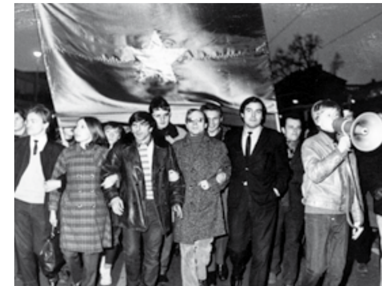
Rudi Dutschke (im gestreiften Pulli) bei einer Anti-Vietnamkriegsdemo in Frankfurt/Main

„68“ hat daher zwei ganz unterschiedliche Bedeutungen: Wer im Osten aufwuchs, denkt an den Prager Frühling, an Alexander Dubcek, die Panzer und das Ende der Illusionen. Wer im Westen aufwuchs, denkt an Rudi Dutschke, Daniel Cohn-Bendit, an Demonstrationen, auch an den Terror der „Roten Armee Fraktion“ und den Marsch durch die Institutionen.