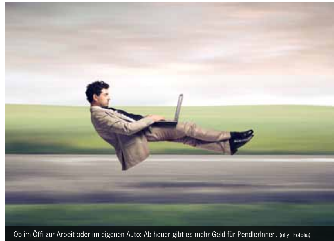
Ob im Öffi zur Arbeit oder im eigenen Auto: Ab heuer gibt es mehr Geld für PendlerInnen.