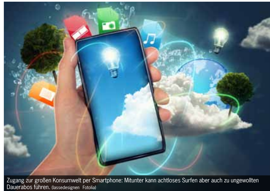
Zugang zur großen Konsumwelt per Smartphone: Mitunter kann achtloses Surfen aber auch zu ungewollten Dauerabos führen. (lassedesignern Fotolia)

Derzeit besteht ein Fachkräftemangel unter anderem bei DreherInnen, SchlosserInnen sowie in der Krankenpflege und Kindergartenpädagogik. Das Fachkräftestipendium gebührt für die Dauer der Teilnahme an der Ausbildung, längstens drei Jahre, in Höhe von 795 Euro monatlich. Studien an Universitäten oder Fachhochschulen sind nicht erfasst.