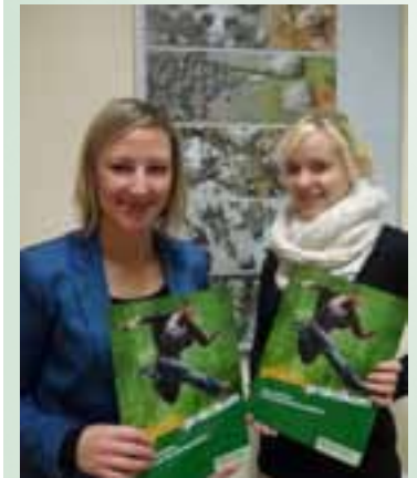
Die neue Praktikumsmappe der Jugendabteilung ist da. (AK)

Immer mehr Ausbildungspläne sehen die Absolvierung von Pflichtpraktika vor. Für viele SchülerInnen ist es oft das erste Arbeitsverhältnis. Mit der AK-Pflichtpraktikumsmappe werden die wichtigsten Fragen bereits im Vorfeld beantwortet. In der Mappe enthalten sind: Mustervertrag, Tipps, Checkliste und eine Tabelle für Arbeitszeitaufzeichnungen. Bestellungen jederzeit möglich unter bjb@akstmk.at