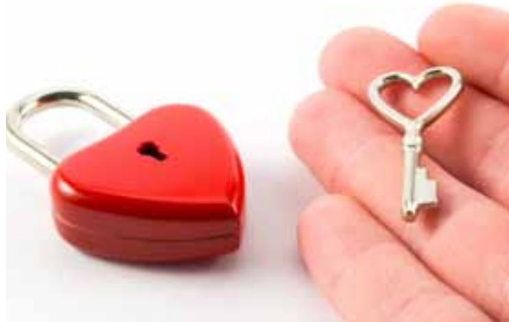
Wenn der Schlüssel zum Herzen doch nicht passt, können die Dienstleistungen einer Partneragentur sehr teuer werden.

Die Rückmeldungen der Kunden sind jedoch ernüchternd: Einerseits läuft die Vermittlung schlecht; die nicht gerade zahlreich vermittelten Frauen heben ihr Telefon nie ab oder erklären sofort, kein Interesse zu haben. Oder die Profile stimmen überhaupt nicht überein – der Landwirt und zweifache Vater gerät an eine Frau, die im urbanen Umfeld auf der Suche ist und keine Kinder mag. Dabei wäre gerade die Vorauswahl nach Übereinstimmung zwischen den KandidatInnen die eigent-