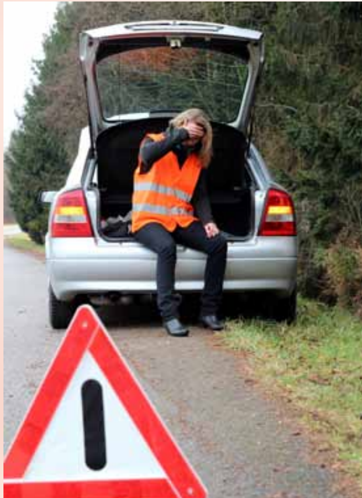
Unfall mit eigenem Pkw in Dienstaufübung: Arbeitgeber haften für Schäden, wenn kein Firmenauto zur Verfügung steht.